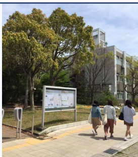
三重大キャンパス

この「東紀州教育学舎通信」を今年度も月一回配布する予定です。配布先は、三重大大学の関係者、東紀州5市町村教育委員会と大台町・大紀町の教育委員会及び7教育委員会管轄の小学校・中学校・幼稚園、7市町の首長部局、及び昴学園高校、尾鷲高校、木本高校、紀南高校、くろしお学園高校、くろしお学園おわせ分校、東紀州教育支援事務所です。