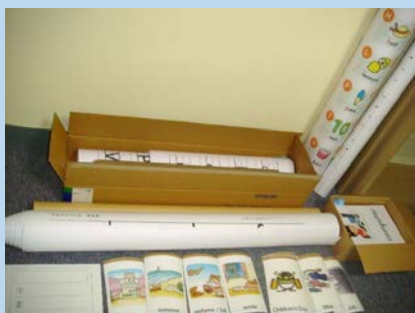
フラッシュカード・絵カード等