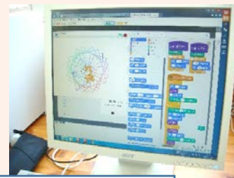
熊野市立新鹿小学校 プログラミング学習