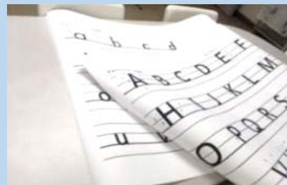
アルファベット大判プリント