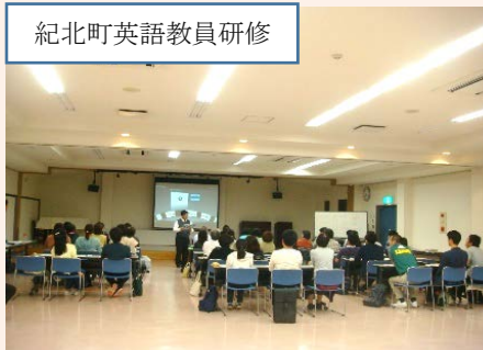
紀北町英語教員研修