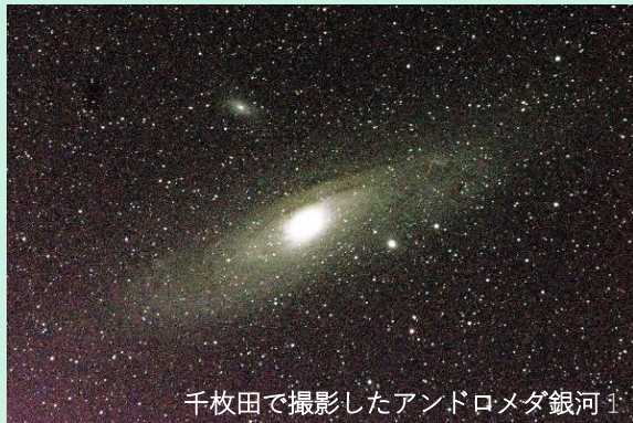
千枚田で撮影したアンドロメダ銀河1