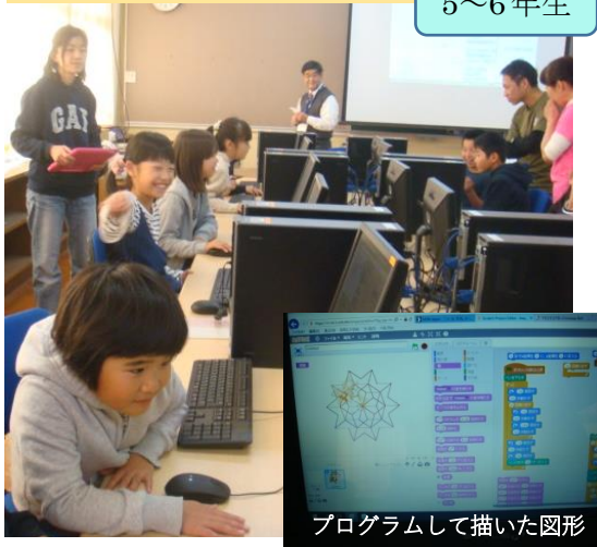
プログラムして描いた図形