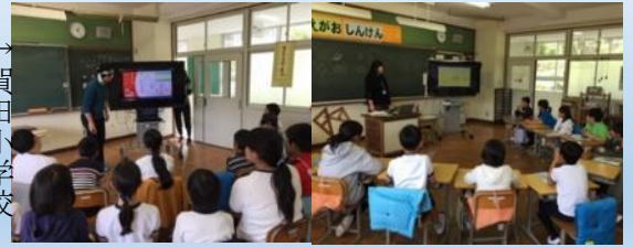
担任の先生もゲームに入り大喜び 5/9