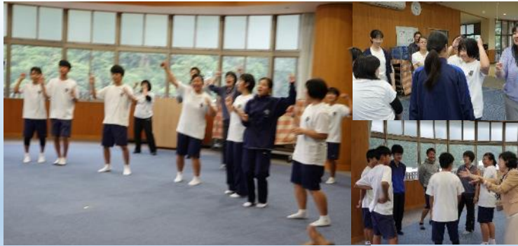
ジェスチャーで覚える会話表現の練習でノリノリ 5/20

本年度から2年間、小中9年間を見通した英語教育のカリキュラムを提案し、出前授業等を通じ尾鷲市輪内地区をサポートしていきます。