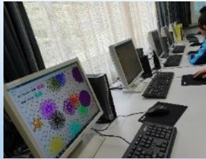
大紀小学校6年生と5年生 5/21↑

「難しいと思っていたけれど簡単だった。」「図形や模様を描くのが楽しかった。」などの声が聞かれました。