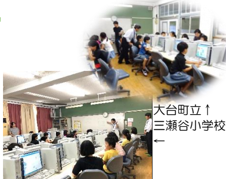
大台町立↑ 三瀬谷小学校 ←

〒519-4394 三重県熊野市木本町 1101-4 三重県立木本高等学校 旧寄宿舎(南風寮) Tel: 0597-89-7015 Fax: 0597-89-7015 E-mail: edu-hksat@edu.mie-u.ac.jp