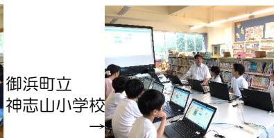
御浜町立 神志山小学校 →