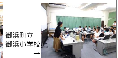
御浜町立 御浜小学校 →