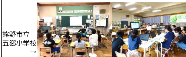
熊野市立 五郷小学校 →

ご希望の学校は、ぜひお問い合わせください。 →Tel: 0597-89-7015 E-mail: edu-hksat@edu.mie-u.ac.jp