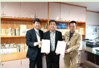
大紀町教育委員会にて確認書取り交わし