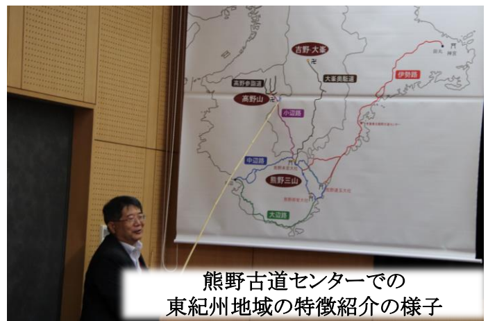
熊野古道センターでの東紀州地域の特徴紹介の様子