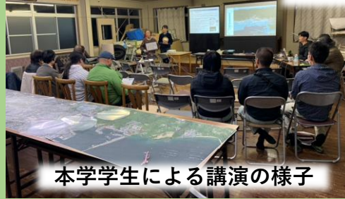
本学学生による講演の様子

この日は昼と夜の2回に分けての実施でした。天満浦地区での津波被害想定可視化と、避難経路の具体化を行いました。GISにより可視化された津波浸水想定を見ることで、防災意識が向上するかどうかを調査しています。