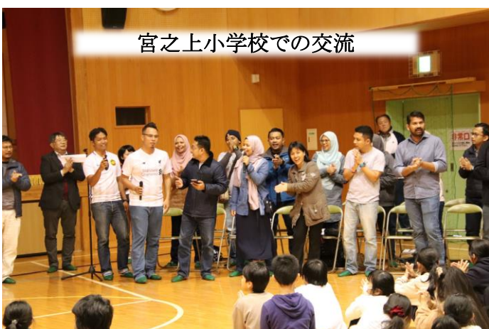
宮之上小学校での交流