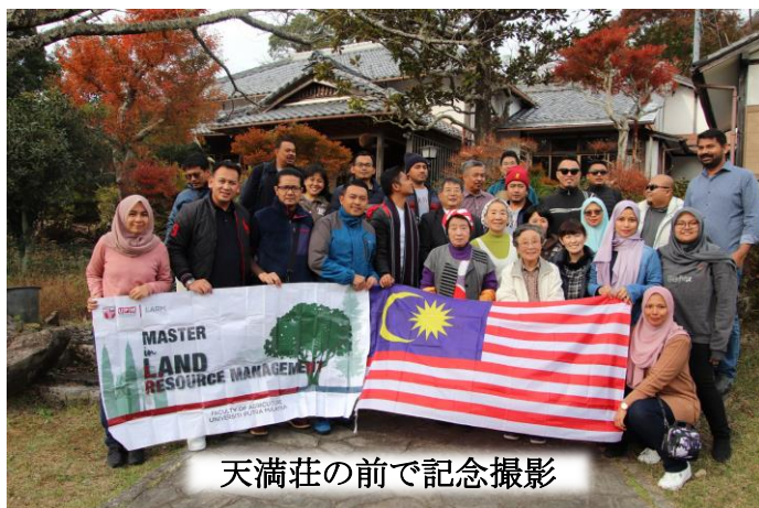
天満荘の前で記念撮影