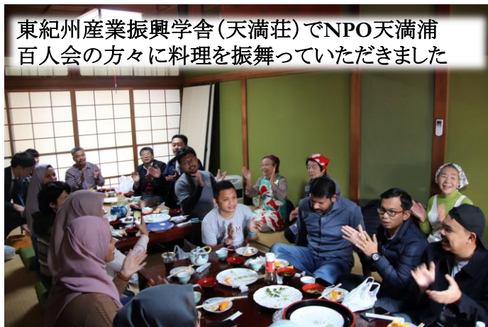
東紀州産業振興学会(天満荘)でNPO天満浦百人会の方々に料理を振舞っていただきました

三重大学とプトラマレーシア大学は大学間の学術交流協定を結んでおり、今回の訪問は協定に基づいた教職員・学生との交流になります。2019年12月9日から来県した院生達は専攻が農林系であり、大学院科目「天然資源政策論」の一環で三重大学を訪問し、東紀州地域の地場産業である農林水産業を通じた地域振興に