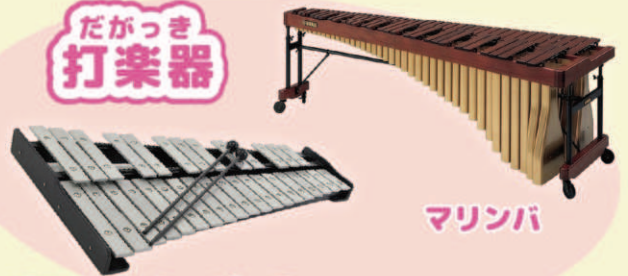
グロッケンシュピール