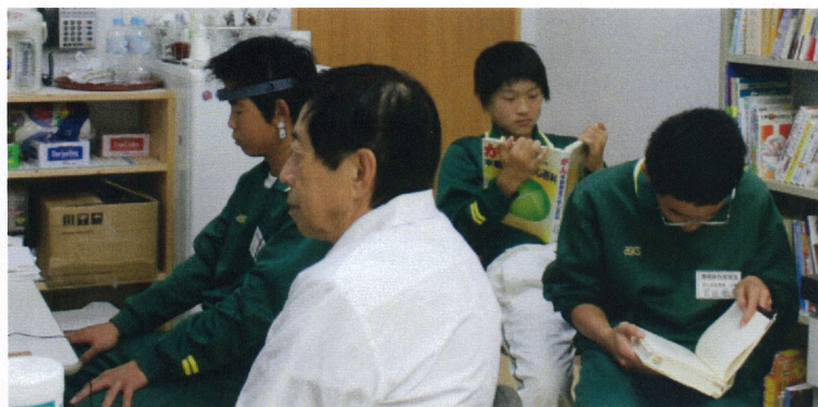
脳波の測定を受ける生徒たち